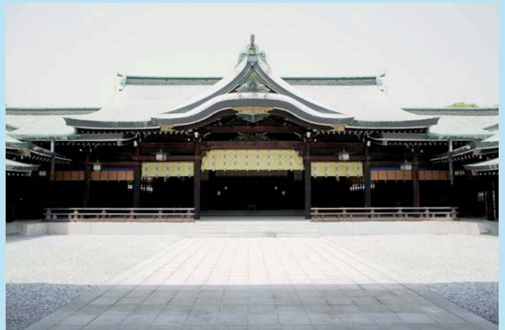
Meiji schrijn, Tokyo