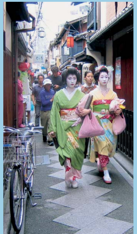
Geisha straatje, Kyoto